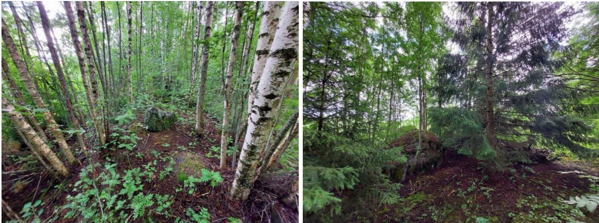
Kuva 3. Vasemmalla alueen 1 nuorehkoa lehtimetsää ja aukkoista pensas- ja aluskasvillisuutta pengermän päällä. Oikealla metsikön itänurkassa kasvoi yksi muuta puustoa isompi, muttei varttunut, kuusi.

Metsikön 1 eteläpuolella kasvaa korkeaa vadelma-maitohorsmakasvustoa sekä yksittäisiä pajupensaita sekä tuomia. Avoimen vadelmakasvuston ja vanhan pellon välissä on muutamia lohkareita, muutama koivu, pihlaja ja nuori kuusi sekä avoin maalaikku, jossa kasvoi mm. metsälauha, niittyleinikki ja lillukka (kuva 4, rajaus kuvassa 1).