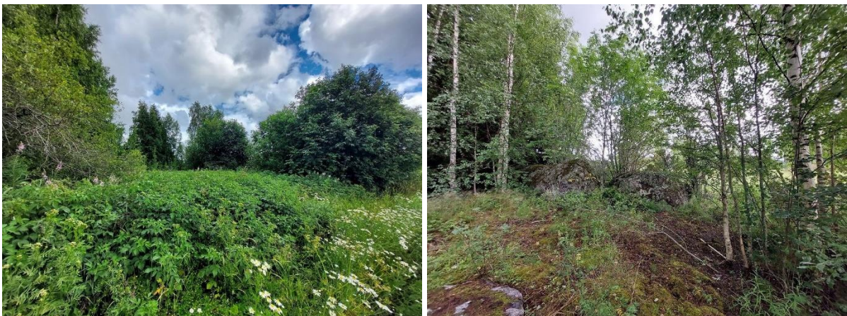
Kuva 4. Vasemmalla vadelma-maitohorsmavaltainen avoin alue. Oikealla lohkareiden ja puiden ympäröimä avoin maalaikku.

Metsikön 1 eteläpuolella kasvaa korkeaa vadelma-maitohorsmakasvustoa sekä yksittäisiä pajupensaita sekä tuomia. Avoimen vadelmakasvuston ja vanhan pellon välissä on muutamia lohkareita, muutama koivu, pihlaja ja nuori kuusi sekä avoin maalaikku, jossa kasvoi mm. metsälauha, niittyleinikki ja lillukka (kuva 4, rajaus kuvassa 1).