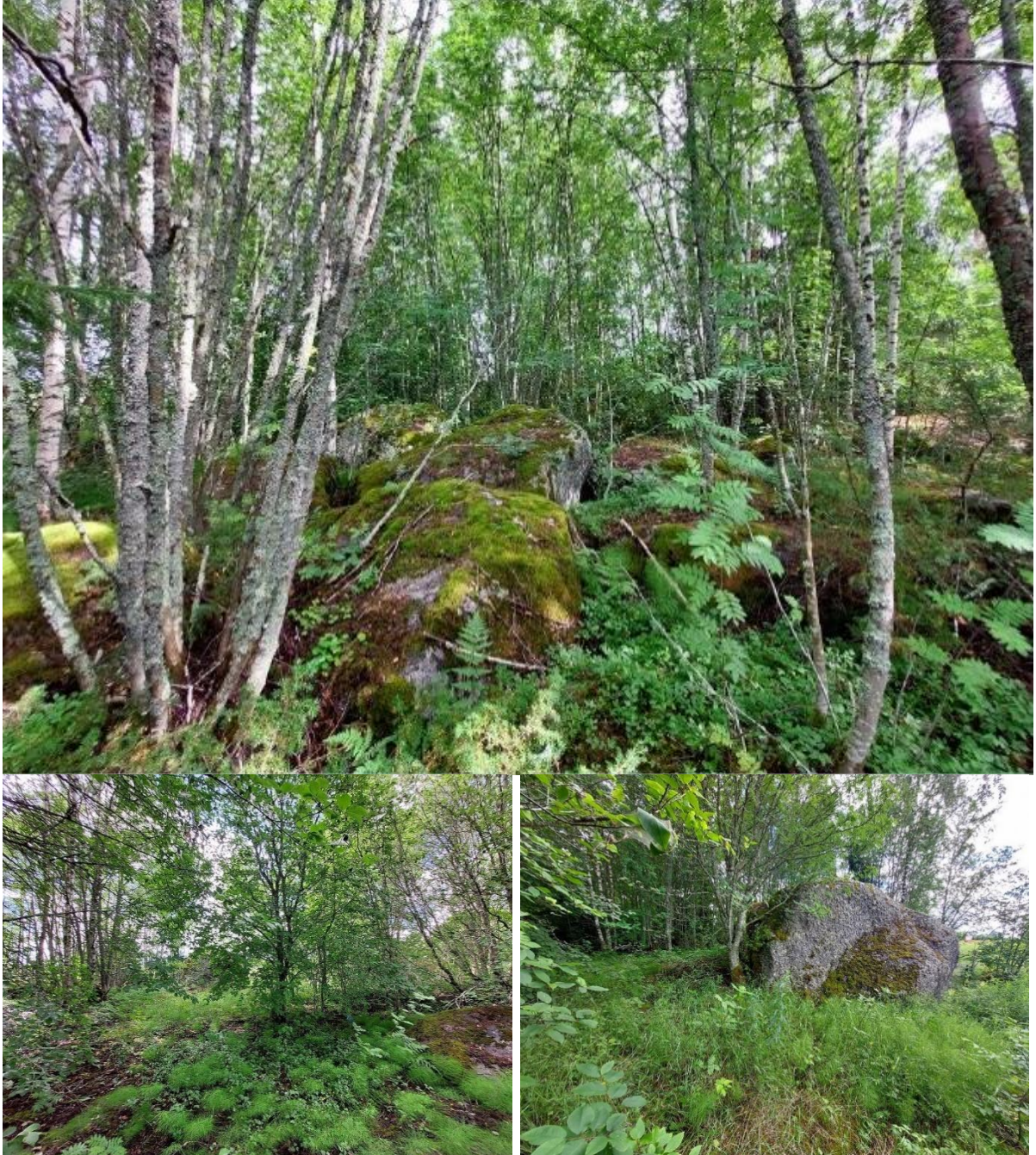
Kuva 5. Ylimmässä kuvassa keski- ja länsiosa metsiköstä 2 oli hyvin kivistä ja puusto koostui suurimmaksi osaksi tyvestä haarovista nuorehkoista lehtipuista. Alhaalla vasemmalla metsikön tasaista pohjoisosaa. Alhaalla oikealla pellon ja metsikön reunalla oleva lohkare ja pohjoisnurkan sekaista niitty- ja metsälajistoa.

mäntyjä ja raita. Aluskasvillisuutena oli metsäkorte, rönsyleinikki, niittyleinikki, nurmitädyke ja metsälauha. Alueelle oli joskus kasattu myös roskia, muun muassa muovia, lasia ja metallia. Itä-laitaa reunusti oja, jonka ympärillä kasvoi runsaasti pajuja.