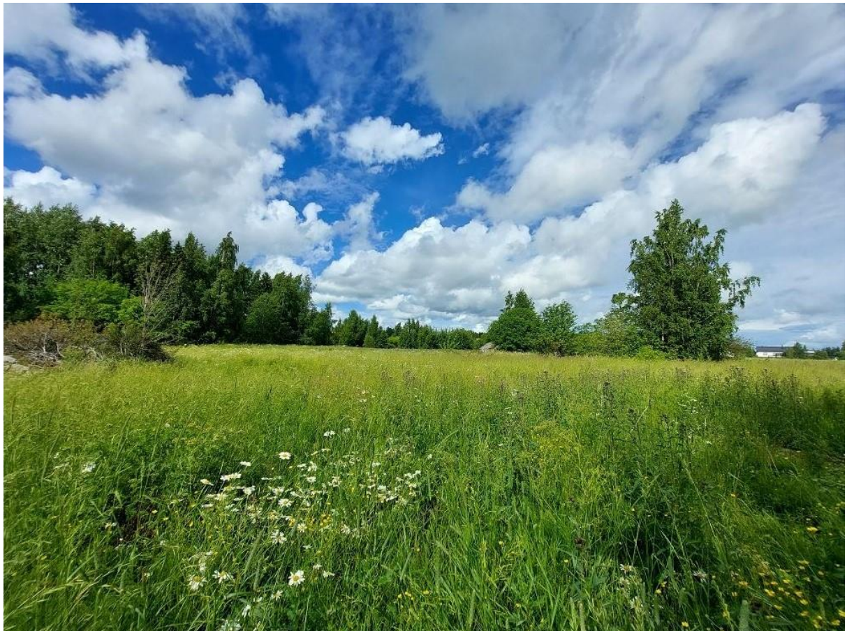
Kuva 2. Metsiköiden välissä sijaitseva vanha peltoalue. Kuvassa aivan vasemmalla on pihlajan ja matalan katajan ympäröimä lohcare ja oikealla taempana kaksi pientä puustoista laikkua.

Metsiköiden välissä avoimella alueella kasvoi erilaisia heiniä sekä niitty- ja piennarruohoja ja muutamia puita ja pensaita kivien ympärillä (rajattu kuvaan 1). Alue oli kasvillisuuden perusteella ollut joskus lannoitettua vanhaa peltoa eikä esimerkiksi perinnebiotooppia, kuten niittyä. Vanhalla pelolla kasvoivat muun muassa runsaimpina timotei, päivänkakkara, ukonputki, juolavehna, peltoohdake, pietaryrtti, puna-apila, niittyleinikki ja voikukka. Sen keskellä oli neljässä kohdassa suurempia kivilohkareita, joiden ympärillä kasvoi matalia katajia ja pihlajia sekä suurimmalla laikulla koivuja (kuva 2).