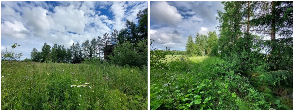
Kuva 6. Lehtikuusista ja mänyistä koostuva puurivi tien vierellä. Puurivin vasemmalla puolella pienempi eteläisistä metsiköistä ja oikealla suuremman metsikön reunalla kasvavaa pajukkoa.

Metsiköiden 2 ja 3 välissä kasvoi tietä reunustava lehtikuusi- ja mäntyryvi (rajattu kuvaan 1, kuva 6).